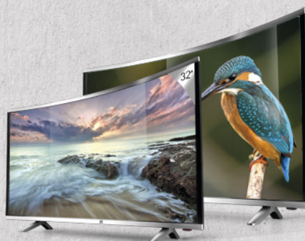
TELEVISION CURVE 32" y 39"

C/ Margarita 34, 36 y 38 (POLIG. IND. EL LOMO) Humanes de Madrid. 28970 MADRID Teléfono: 902 040 252 / Fax: 91 279 15 19 902040252@lufthous.es http://www.lufthous.es